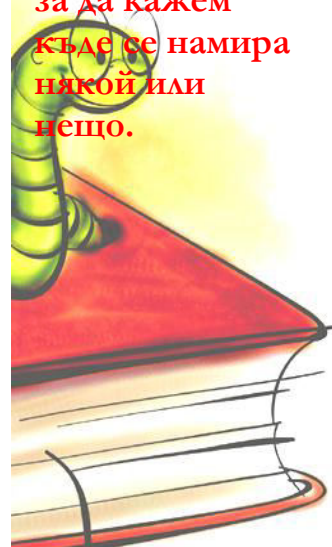
G. Solakova Hristo Smirnensky school Town of Kubrat