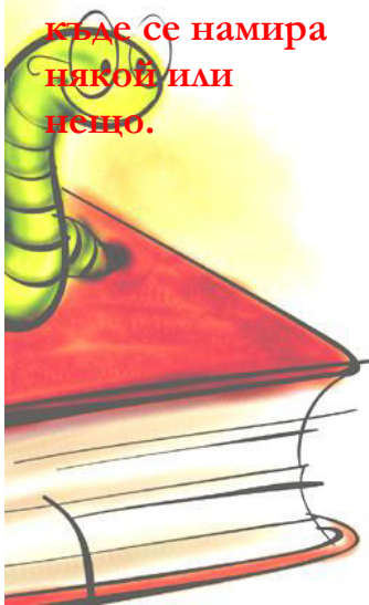
G. Solakova Hristo Smirnensky school Town of Kubrat