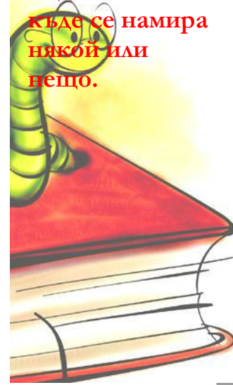
G. Solakova Hristo Smirnensky school Town of Kubrat