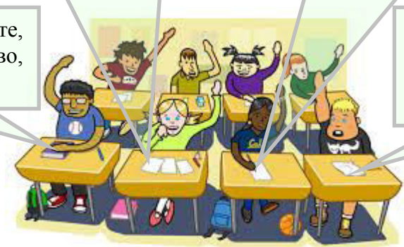
Тони Еми Гюлтен Владо

Нежива природа са планина, птица, вода, слънце, море, равнина, въздух, скали.